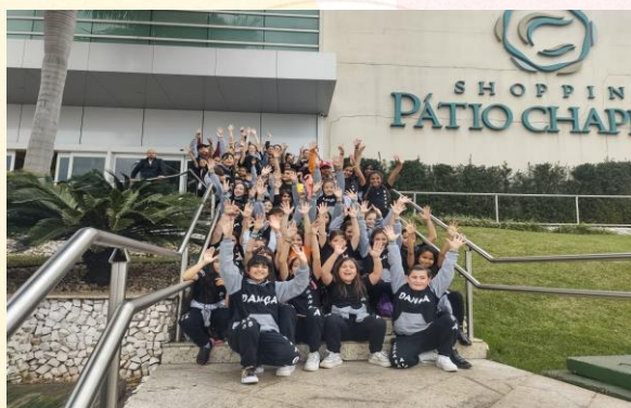
Shopping Pátio Chapecó, Chapecó (SC)

Já os alunos da categoria infantil ganharam uma tarde no cinema de Chapecó com pipoca e refrigerante.