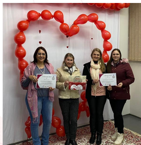
Representantes no Hemosc, Chapecó (SC)

O Centro de Hematologia e Hemoterapia de Santa Catarina – HEMOSC agradeceu a Fundação Aury Luiz Bodanese e a Aurora Coop pelas doações realizadas em comemoração ao 14 de junho - Dia Mundial do Doador de Sangue. Reconhecendo neste tão nobre gesto a empatia e solidariedade para com a sociedade.