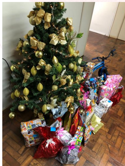
Arrecadações de presentes no Frigorífico Aurora Coop Sarandi (RS)

O Natal Voluntário faz parte do planejamento de ações das unidades da mantenedora, oportunidade que as mesmas organizam arrecadação de presentes com o objetivo de atender entidades diversas e associações de catadores de materiais recicláveis tornando o Natal de muitas crianças ainda mais feliz. Algumas unidades ainda proporcionaram um dia diferente, com a chegada a Papai Noel, distribuição de lanche e atividades lúdicas e interativas.