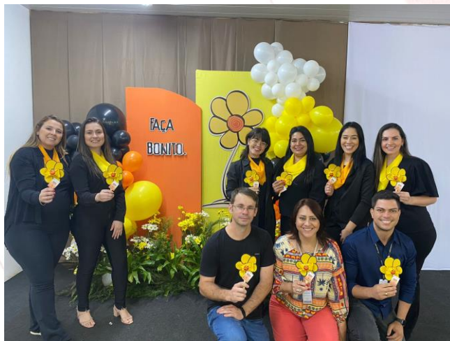
São Gabriel do Oeste (MS)

abuso e a exploração sexual de crianças e adolescentes, ao assédio sexual e moral e a cultura do estupro – Lei 4.970/MS. E evento contou com a participação de representantes do legislativo municipal e também do Ministério Público.