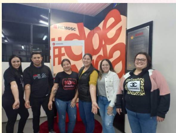
Voluntários do Incubatório Chapecó (SC)