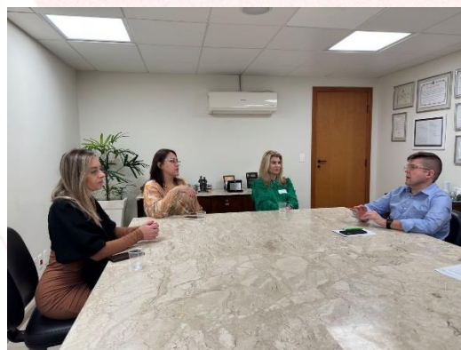
Reunião ALESC, Florianópolis (SC)

Representes da Fundação Aury Luiz Bodanese e Aurora Coop, estiveram presentes na Assembleia Legislativa de Santa Catarina, afim de proporem melhorias na Lei de Cotas para Pessoas com Deficiência.