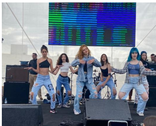
Praça da Cooperação