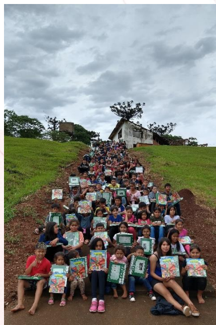
Ação Cooperada na Escola Indígena Cacique Vanhkre, Ipuacu (SC)

No município de Ipuacu (SC) a Ação Cooperada foi organizada juntamente com as unidades da Aurora Coop de Abelardo Luz (SC), Quilombo (SC) e Xaxim (SC), na Escola Indígena Cacique Vanhkre, participaram da ação aproximadamente 250 pessoas.