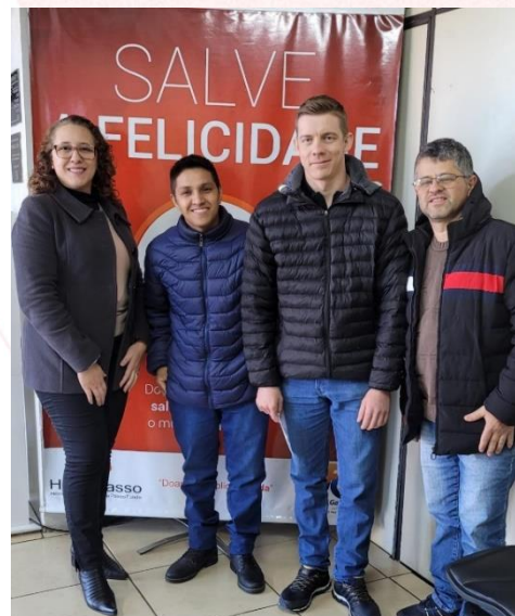
Voluntários da Indústria Aurora Coop Chapecó I (SC)