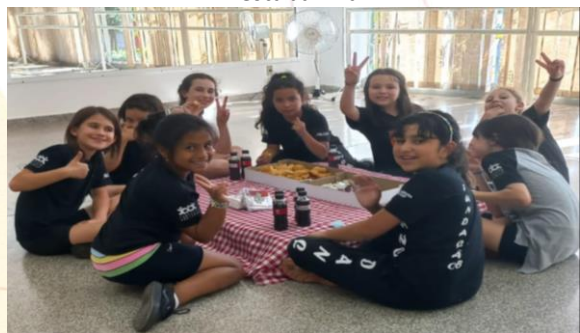
Dia das Crianças