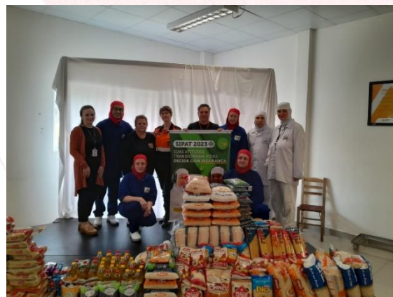
Frigorífico Aurora Coop Maravilha (SC)

A doação de alimentos é uma maneira direta e imediata de ajudar as pessoas necessitadas. Os alimentos arrecadados podem ser entregues rapidamente a quem precisa, proporcionando alívio imediato.