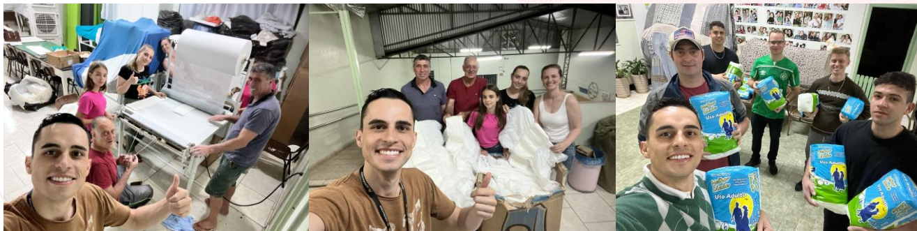
Voluntários em atividade na APAE de Xaxim (SC)