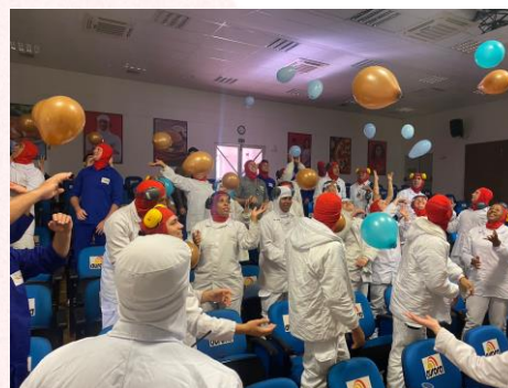
São Gabriel do Oeste (MS)