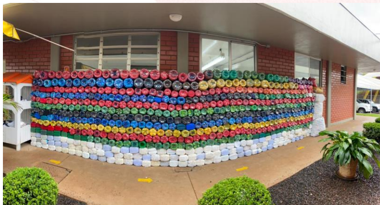
Tampas plásticas arrecadadas no Frigorífico Aurora Coop Chapecó I

tanto em arrecadações quanto em cooperação.