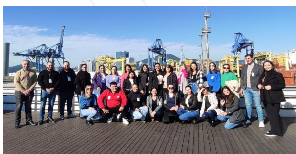
Voluntários na Portonave, Navegantes (SC)