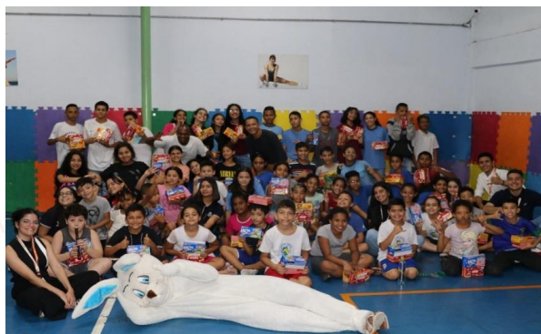
Comercial Corporativa Aurora Coop Guarulhos (SP)