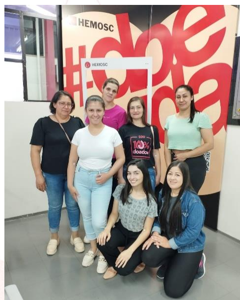
Voluntários do Frigorífico Aurora Coop Xaxim (SC)

A doação de sangue é um ato voluntário que pode salvar muitas vidas. Ação que já é consolidada nas unidades da mantenedora Aurora Coop e que tem como objetivo manter os estoques dos hemocentros abastecidos. Nossos voluntários são conscientes da importância desta ação e a cada ano aumentamos o número de voluntários comprometidos com esta causa.