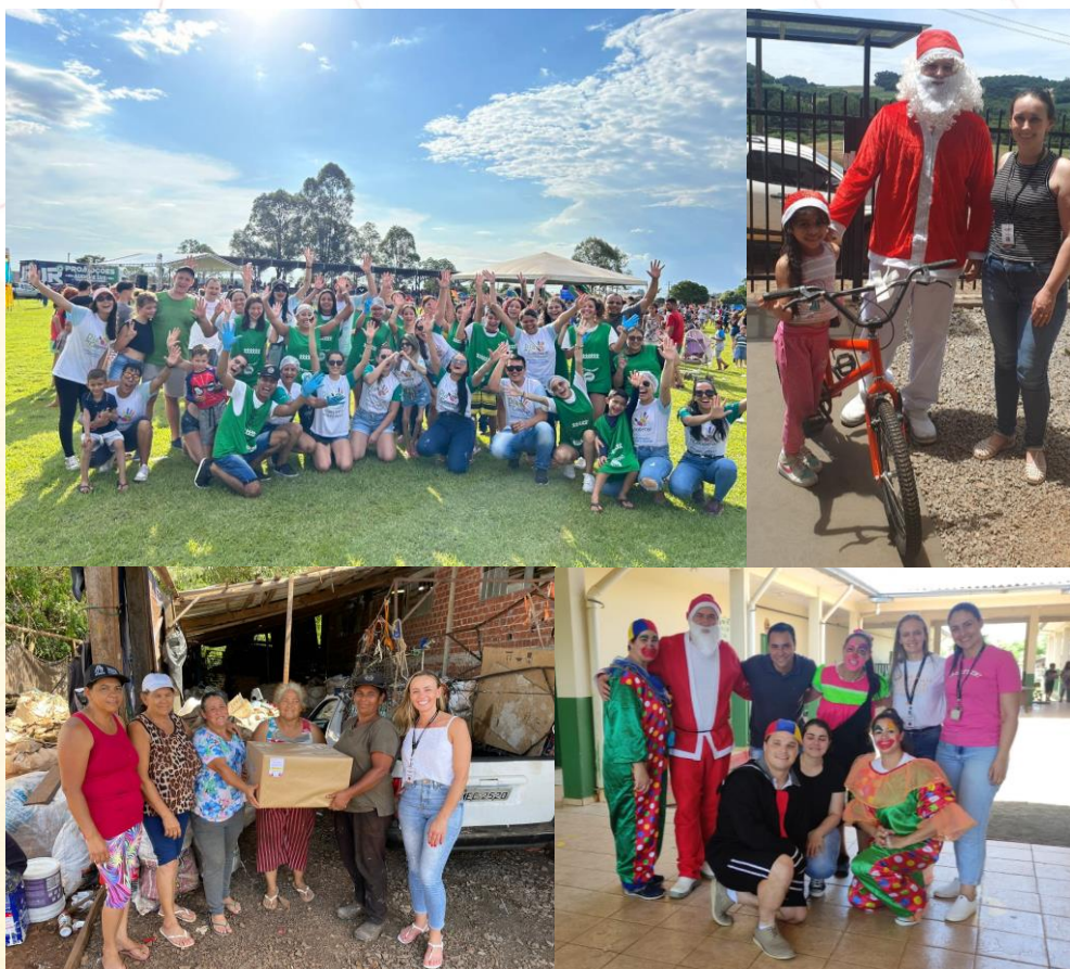
Natal Voluntário pelas unidades Aurora Coop

Em cada gesto de solidariedade está a verdadeira magia do Natal.