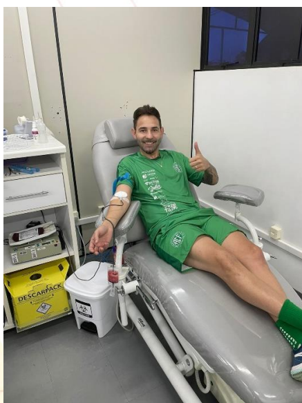
Doação de sangue

Atletas da Chapecoense Futsal foram até o Hemocentro de Chapecó (SC) para realizar uma ação simples, rápida e poderosa, que representa um ato de solidariedade e amor a doação de sangue! A iniciativa foi motivada pela parceria entre a Fundação Aury Luiz Bodanese e a Chape Futsal, que vem para reforçar a responsabilidade social do Verdão das quadras e o compromisso do clube com a comunidade.