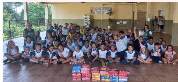
Unidades Aurora Coop de Mandaguari (PR)