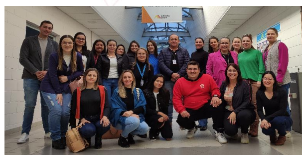
Voluntários na Unidade de Exportação de Itajaí (SC)