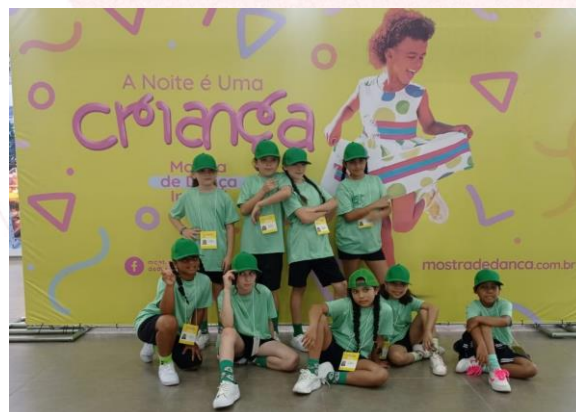
A Noite é uma Criança