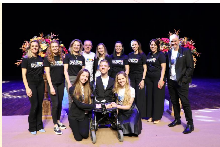
Palestra Família Linck

Também fez parte do evento Viva as Diferenças , a exposição “Exemplos de Superação” , e a palestra motivacional com a Família Linck, “Uma vida sem limites” .