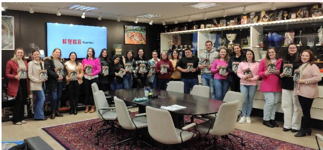
Voluntários no Instituto Guga Kuerten, Florianópolis (SC)