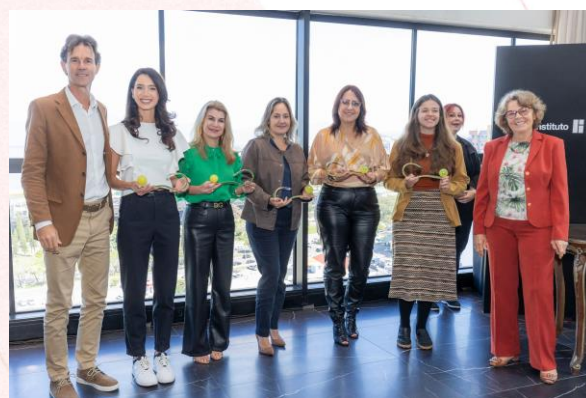
Prêmio IGK, Florianópolis (SC)

A Fundação Aury Luiz Bodanese e sua mantenedora Aurora Coop, receberam troféu na cerimônia de premiação do 20º PRÊMIO IGK pelo trabalho realizado em parceria com o Instituto Guga Kuerten no Estado de Santa Catarina.