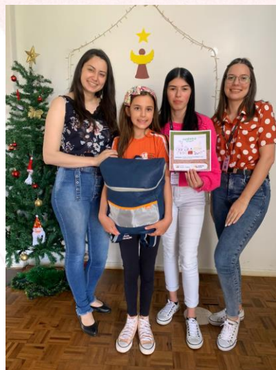
Ganhadora “Master” de Aberlardo Luz (SC)

Toda escola e entidade teve um aluno por série premiado, escolhido pela unidade Aurora Coop que foi presenteado com um estojo ou uma mochila personalizada da A Turminha da Reciclagem, sendo 78 alunos que ganharam um estojo e 25 alunos que receberam uma mochila. Destes 103 alunos premiados, 3 conquistaram também o prêmio “Master” no valor de $100,00 em produtos Aurora.