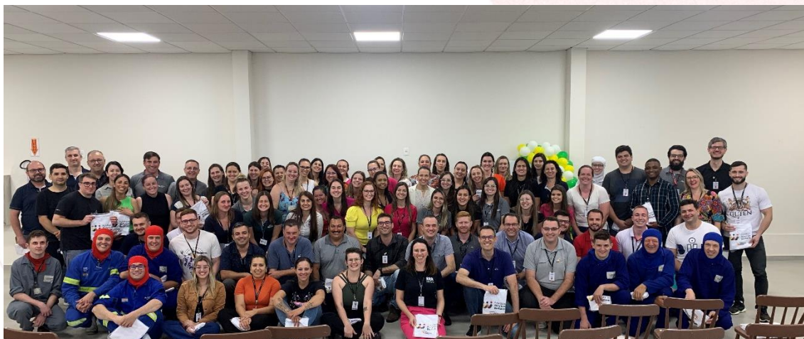
Voluntários das Industriais, Fábrica de Rações e Matriz da Aurora Coop Chapecó (SC)