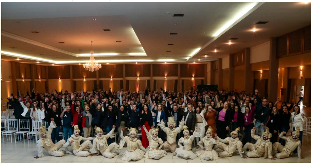
Evento Conexão FALB 2023

O trabalho voluntário é regido pela Lei 9.608 de 18 de fevereiro de 1998 e, atualmente, uma das formas de viabilizar o voluntariado é através da Política Aurora de Voluntariado, onde o colaborador da Aurora Coop pode destinar até 12 horas de trabalho por ano para realizar atividades de voluntariado durante o horário de trabalho.