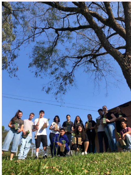
Jovens aprendizes realizaram plantio em Sarandi (RS)

A Fundação ALB recebeu a doação de 200 mudas de árvores nativas da empresa Alcaplas, de Xanxerê (SC), 200 mudas do Parque Estadual das Araucárias, de São Domingos (SC) e 300 mudas da empresa Celulose Irani (SC). As mudas foram destinadas para unidades da Aurora Coop de Chapecó (SC), Abelardo Luz (SC) e Sarandi (RS) realizarem ações em prol a data, como distribuição de mudas de árvores aos colaboradores e também plantio em áreas entorno das unidades Aurora Coop.