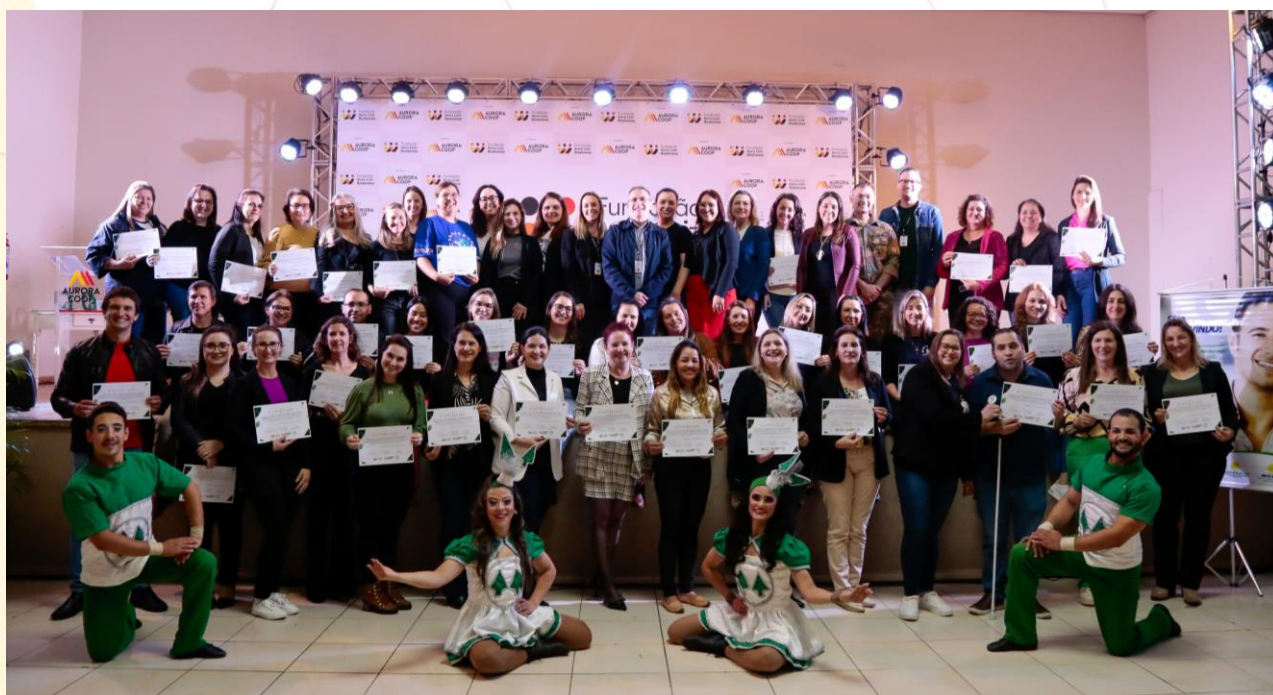
Entrega dos certificados de participação

O evento de premiação, que reuniu lideranças, colaboradores da Aurora Coop e representantes das escolas e entidades sociais, ocorreu no dia 19 de outubro, juntamente com o Conexão FALB, no Centro de Eventos Tabajara em Chapecó (SC).