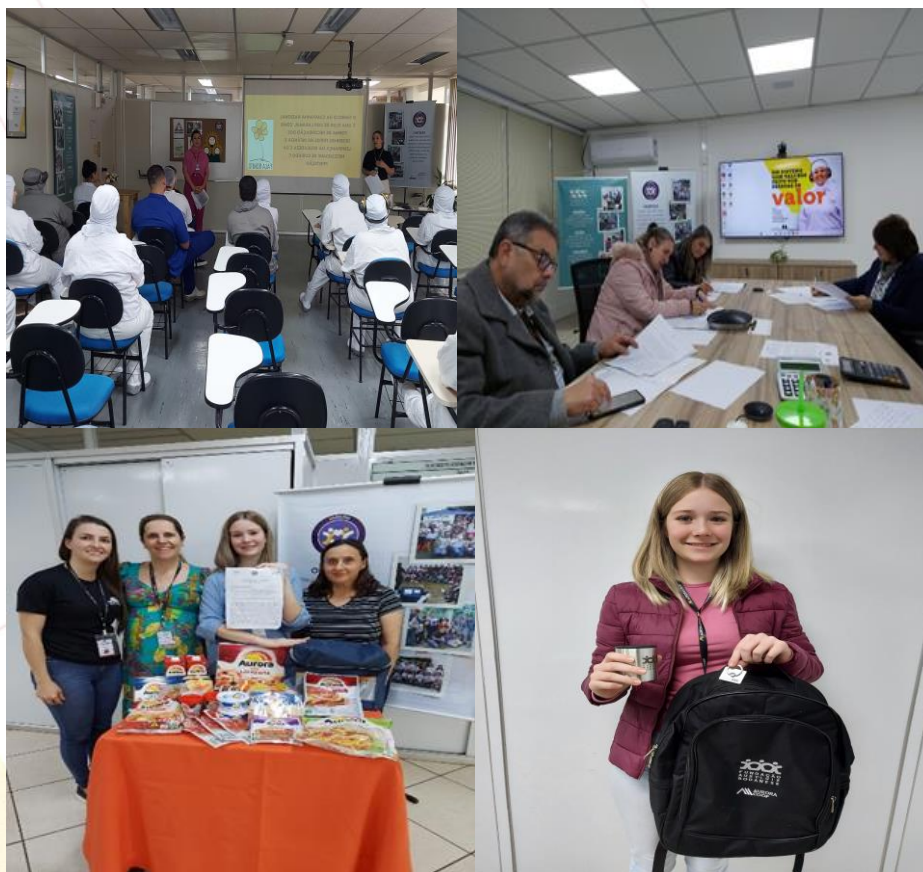
São Miguel do Oeste (SC)