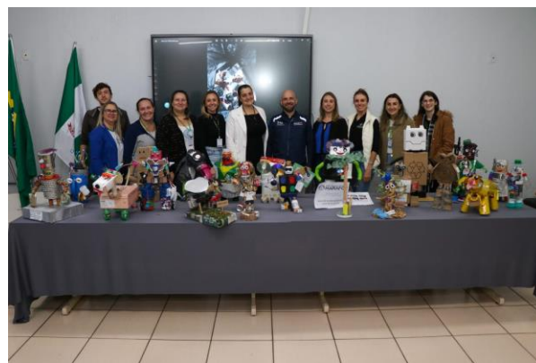
Comissão avaliadora da 2ª Gincana Recicla, Chapecó (SC)