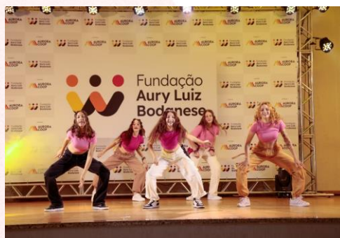
Evento Conexão e Escola Cidadã

bairro Efapi e novamente a turma juvenil do bairro Saic se apresentaram no festival a Noite é uma Criança, em Chapecó (SC).