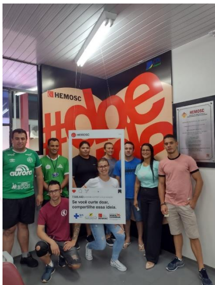
Voluntários do Frigorífico Aurora Coop Sarandi (RS)