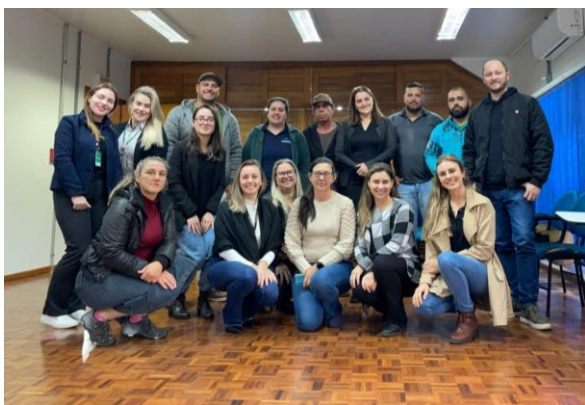
Fórum de Resíduos Sólidos Chapecó – FRSC, Chapecó (SC)

Por meio do Eco Cooperação, a Fundação ALB participa de espaços como reuniões do Fórum de Resíduos Sólidos Chapecó - FRSC e do Comitê Objetivos do Desenvolvimento Sustentável Chapecó - ODS. Também neste ano fez parte da comissão avaliadora da 2ª Gincana Recicla, projeto desenvolvido nas escolas do município de Chapecó (SC) pela Prefeitura Municipal.