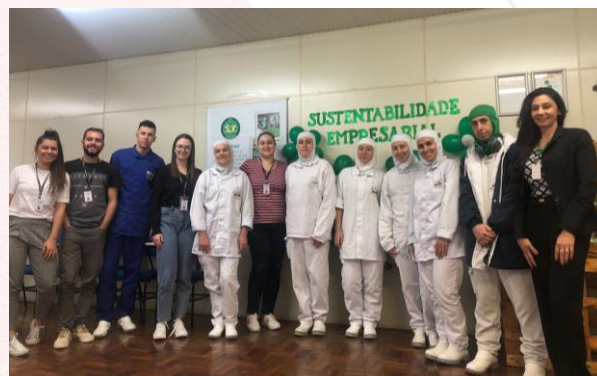
Frigorífico Aurora Coop Sarandi (RS)

Outras ações também marcaram o Dia Mundial do Meio Ambiente. Em Sarandi (RS) a unidade organizou palestra com o tema Sustentabilidade Empresarial aos colaboradores. Também, voluntários desenvolveram atividades em alusão a data em escolas do entorno e murais informativos e demais sensibilizações internas com os colaboradores.