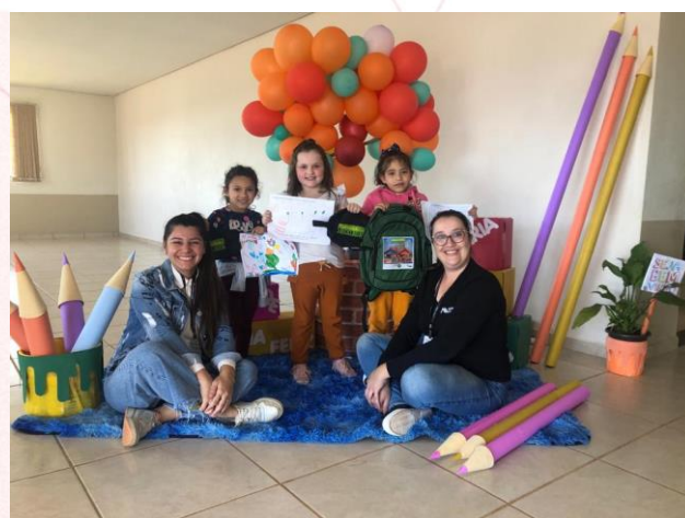
Espaço Criança Feliz, Sarandi (RS)

Através dos voluntários, 18 unidades Aurora Coop, dos estados de Santa Catarina, Rio Grande do Sul, Paraná e Mato Grosso do Sul, realizaram ações do projeto em 26 escolas e entidades, atendendo um público de 2.904 crianças do pré-escolar ao 4º ano. Os alunos atendidos poderiam participar do concurso de desenhos, registrando através de um desenho algo que aprenderam durante a ação com o vídeo da A Turminha da Reciclagem e reflexões sobre a importância do cuidado com o meio ambiente.