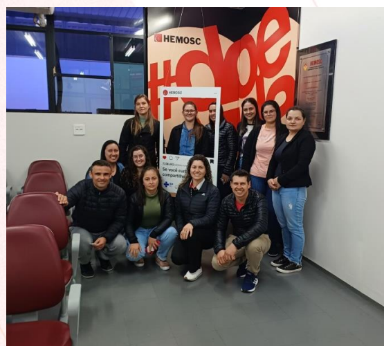
Voluntários do Frigorífico Aurora Coop Quilombo (SC)