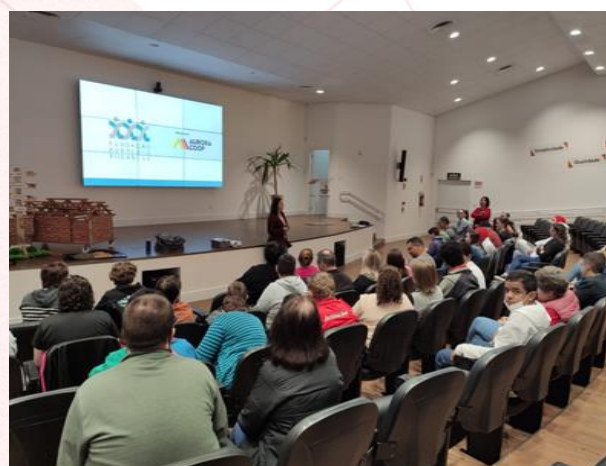
Curso de Qualificação para PCDs, Chapecó (SC)

Visuais do Oeste Catarinense - Adevosco, e Escola Marechal Bormann de Chapecó.