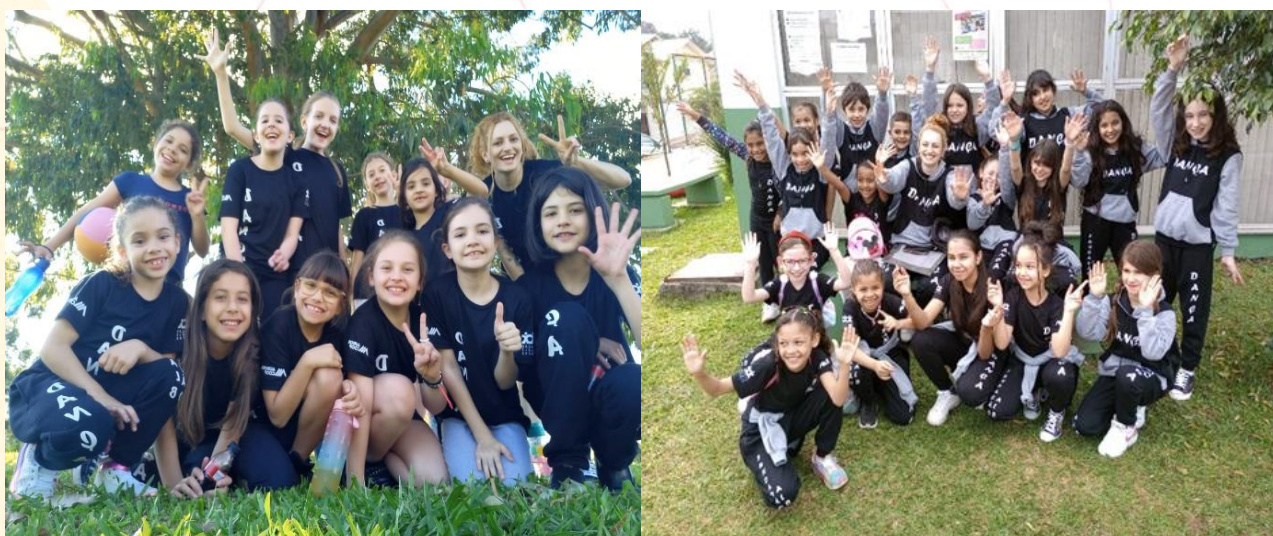
Alunos atendidos pelo programa, Chapecó (SC)

As aulas de dança iniciaram em fevereiro e aconteceram no Ginásio de Esporte Plínio Arlindo de Nês, no bairro Saic, e no Centro de Referência de Assistência Social (CRAS) e na Praça Céu, bairro Efapi, Chapecó (SC) atendendo 80 crianças e adolescentes, divididas em dez turmas nos turnos matutino e vespertino.