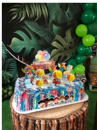
Espaço Criança Feliz, Sarandi (RS)