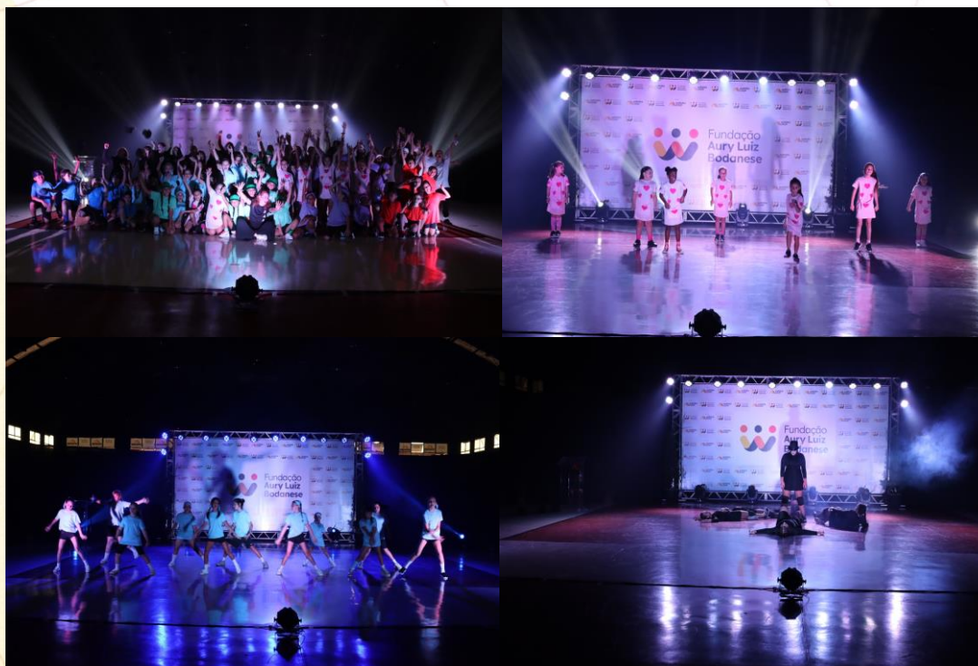
Apresentações na Mostra Cultural

O objetivo da Mostra Cultural é socializar aos familiares e a comunidade, através de apresentações de dança, as aulas de dança trabalhadas durante o ano, além de proporcionar interação entre as famílias e a Fundação ALB, com distribuição de lanche especial e registros na cabine de fotos. Tivemos a colaboração de 05 voluntários, reunindo cerca de 300 pessoas.