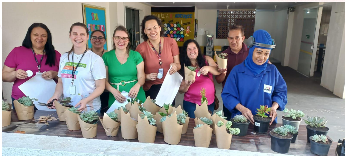
Voluntários atuando no projeto das suculentas

projeto foi idealizado pela entidade, que tem como objetivo plantar as suculentas para depois comercializá-las e reverter o recurso para a entidade. Os voluntários das unidades auxiliaram em todo o desenvolvimento do projeto, desde a organização do espaço, montagem da estufa, plantação das mudas e comercialização das mesmas. As atividades iniciaram em maio e o projeto será executado até o próximo ano.