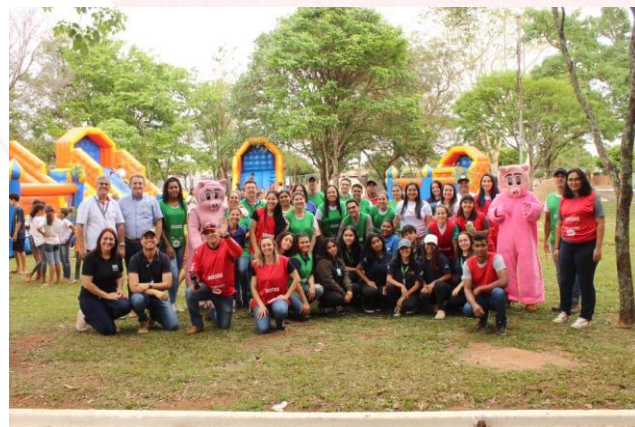
Voluntários na Ação Cooperada

Em São Gabriel do Oeste (MS) a ação foi realizada em parceria com a Cooasgo e apoio da Prefeitura Municipal, aconteceu no Parque Ecológico Águas do Guarani, proporcionando um dia de intercooperação, conhecimento e lazer com atividades voltadas às crianças de escolas do município. Atendeu cerca de 300 alunos das instituições educacionais do município (APAE, Kolping, Casa da Vovó Aida e crianças do Programa Criança Feliz).