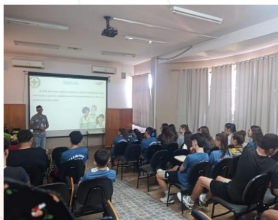
Santiago do Sul (SC)

escolar, através de palestras e oficinas demonstrativas.