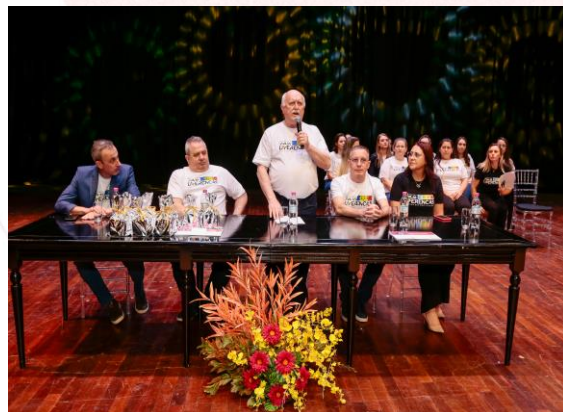
Abertura da Formatura

Durante Workshop “Viva as Diferenças” aconteceu também a formatura do Curso de Qualificação para Pessoas com Deficiência, momento de muita emoção para os formandos, familiares, instrutores, e demais participantes.