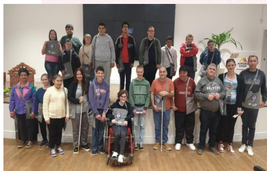
Curso de Qualificação para PCDs, Chapecó (SC)