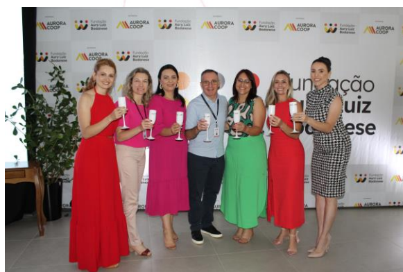
Equipe Fundação ALB

Retrospectivas, homenagens e discursos emocionantes marcaram o encerramento das comemorações dos 15 anos da Fundação ALB em evento que reuniu diretoria e gerentes da Aurora Coop, membros do Conselho Curador e Fiscal e a diretoria executiva da Fundação ALB, parceiros e colaboradores.