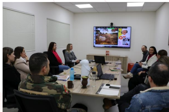
Encontro com a comissão avaliadora

Chapecó) - responsáveis pela categoria Colaboradores Cooperativas Filiadas.