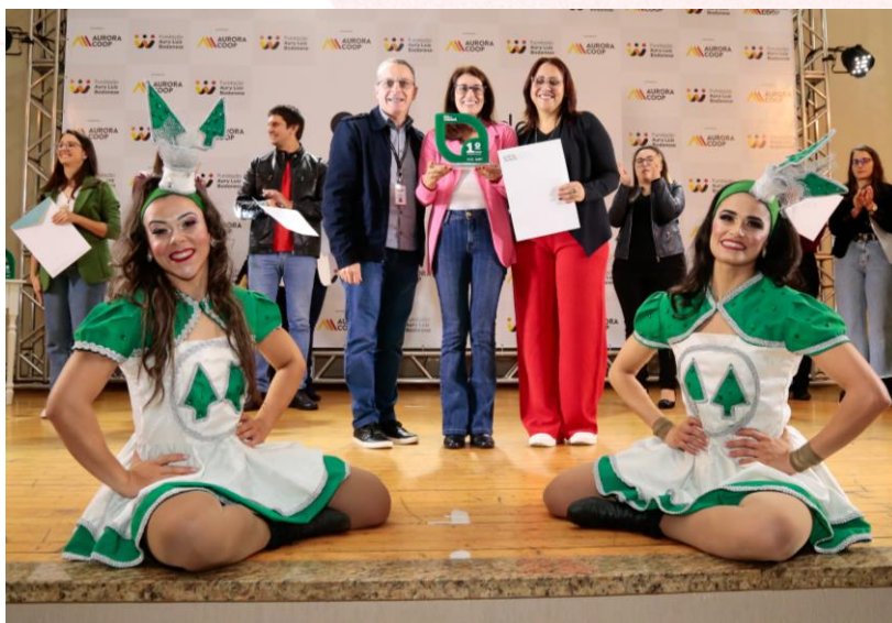
Escola de Educação Básica José Marcolino Eckert

Na categoria Escolas públicas e privadas, em 1º lugar se destacou a Escola de Educação Básica José Marcolino Eckert de Pinhalzinho (SC), e o 2º lugar ficou com o Colégio Agostiniano Mendel, de Tatuapé (SP). Houve a premiação até a décima colocada com maior pontuação.