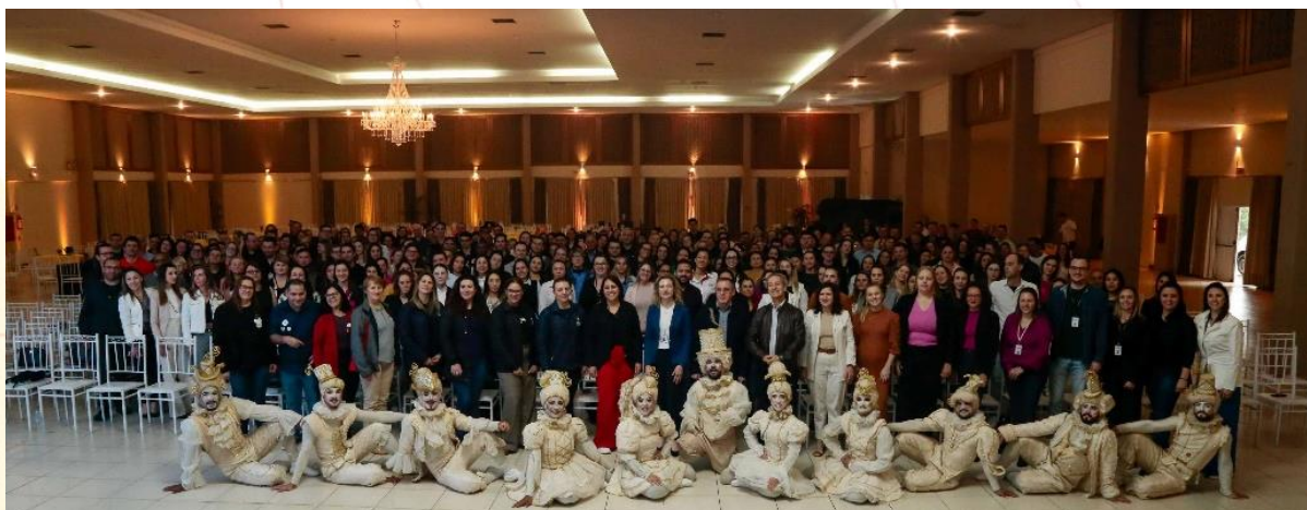
Participantes do evento Conexão FALB 2023

O evento Conexão FALB 2023, aconteceu no Centro de Eventos Tabajara em Chapecó (SC), teve muita emoção, conhecimento e novidades, que reforçaram ainda mais o compromisso social com a comunidade e os princípios do cooperativismo. O evento reuniu lideranças, colaboradores da Aurora Coop e representantes das escolas e entidades sociais. Um dos momentos em destaque foi a apresentação da nova identidade visual da Fundação Aury Luiz Bodanese e dos programas que foram remodelados e passaram a ter novos nomes e objetivos. Palestra Show – O Poder da Decisão e apresentações/espetáculos com o Espaço Sou Arte, explanação sobre a importância das ações da Fundação junto a sua mantenedora e anúncio dos ganhadores da Ação do Dia Mundial da Limpeza.