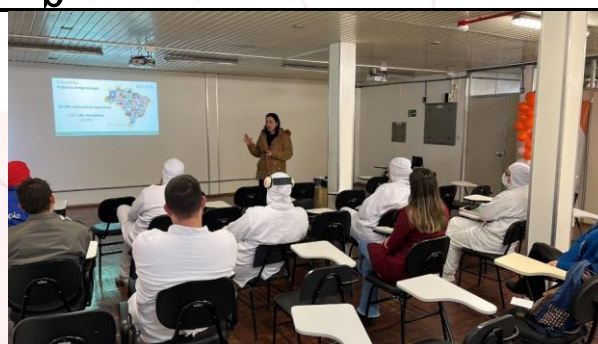
Frigorífico Aurora Coop Maravilha (SC)

As sensibilizações são realizadas para motivar os grupos de voluntários e gestores, com o objetivo de apresentar as diretrizes da Política Aurora de Voluntariado e o planejamento das ações propostas para execução durante o ano.