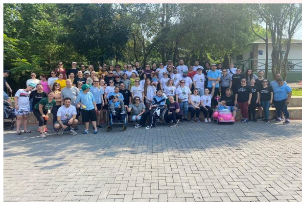
Caminhada Inclusiva no Eco Parque, Chapecó (SC)

Este ano a Fundação Aury Luiz Bodanese contribuiu com a realização da Semana Inclusiva, coordenada pelo Ministério Público do Trabalho da 12ª Região - MPT/SC, Superintendência Regional do Trabalho de Santa Catarina em parceria com mais de 50 entidades governamentais e não governamentais, promovendo a inclusão de pessoas com deficiência e reabilitados do INSS no mundo do trabalho.