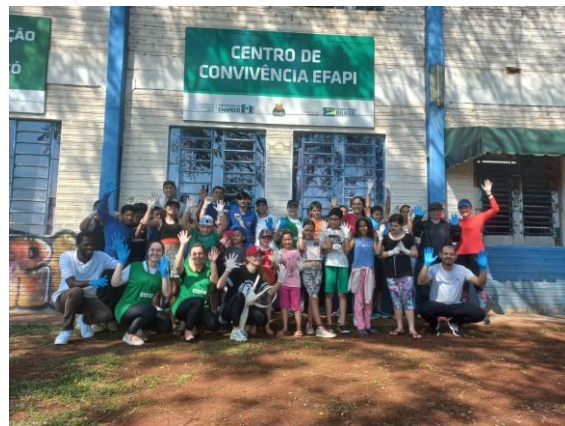
Dia Mundial da Limpeza