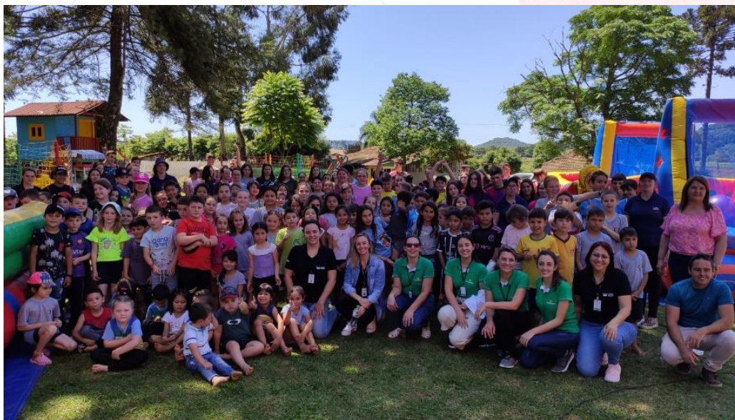
Ação Cooperada na Escola Maria Luiza Osório Zumner, Tangará (SC)

dispostos a concretizar as atividades com comprometimento. Foi produtivo e os alunos já estão perguntando quando teremos essa atividade novamente”, frisou ao agradecer pela oportunidade.