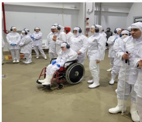
Curso de Qualificação para PCDs, Chapecó (SC)