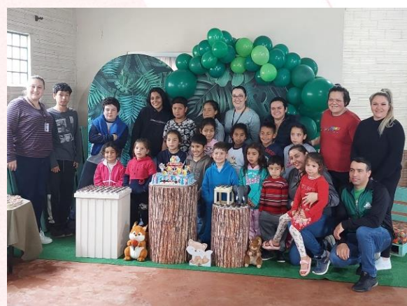
Espaço Criança Feliz, Sarandi (RS)

brincadeiras e diversão, pois muitos nunca tiveram uma festa de aniversário.