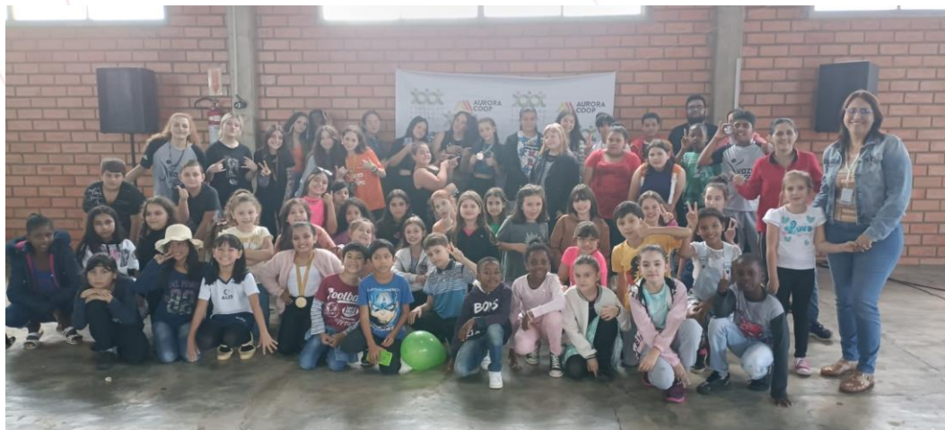
Dia Internacional da Dança, Chapecó (SC)

No Dia Internacional da Dança, 29 de abril, foi promovido um desafio para as crianças e adolescentes, no qual eles deveriam montar uma sequência coreográfica de no mínimo trinta segundos até no máximo um minuto e se apresentarem para os colegas e mesa avaliadora da Aurora Coop mantenedora da Fundação ALB, a atividade aconteceu no espaço do Ser da Aurora no bairro Saic, Chapecó (SC). As premiações foram com medalhas do primeiro ao terceiro lugar em duas categorias juvenil e infantil.