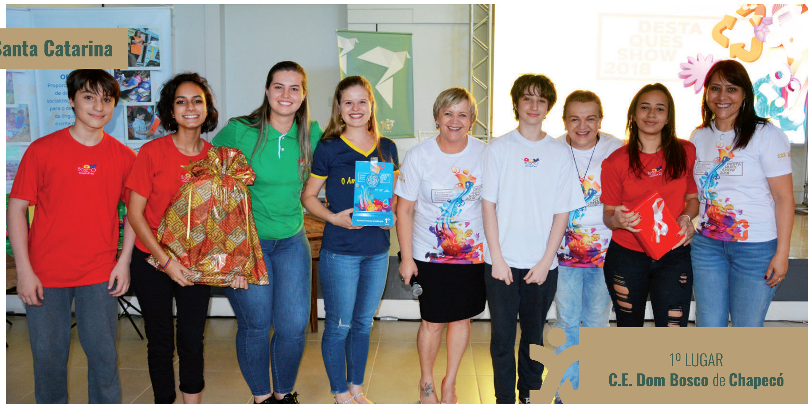
1º LUGAR C.E. Dom Bosco de Chapecó