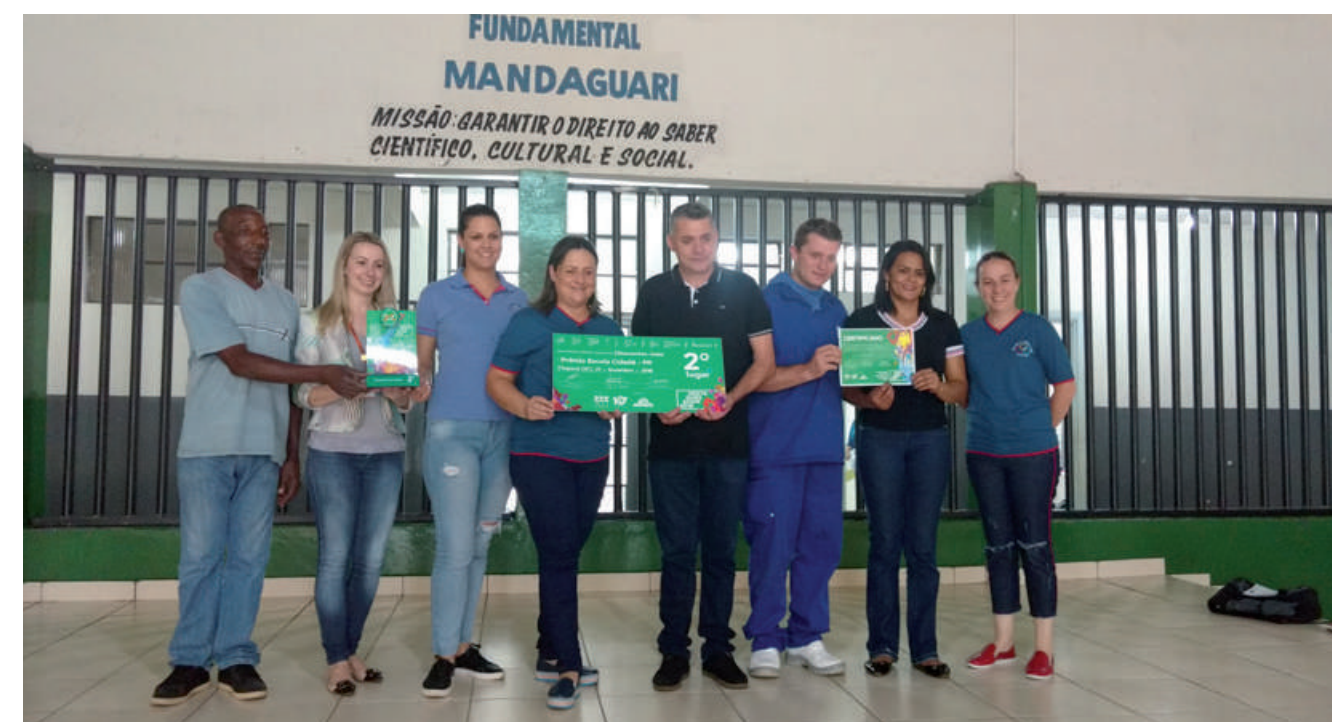
2º LUGAR Escola Municipal Francisco Romagnole Júnior de Mandaguari (PR) “Ensinando a cuidar da Vida; Saúde na Escola; Gincana Cidade Limpa”