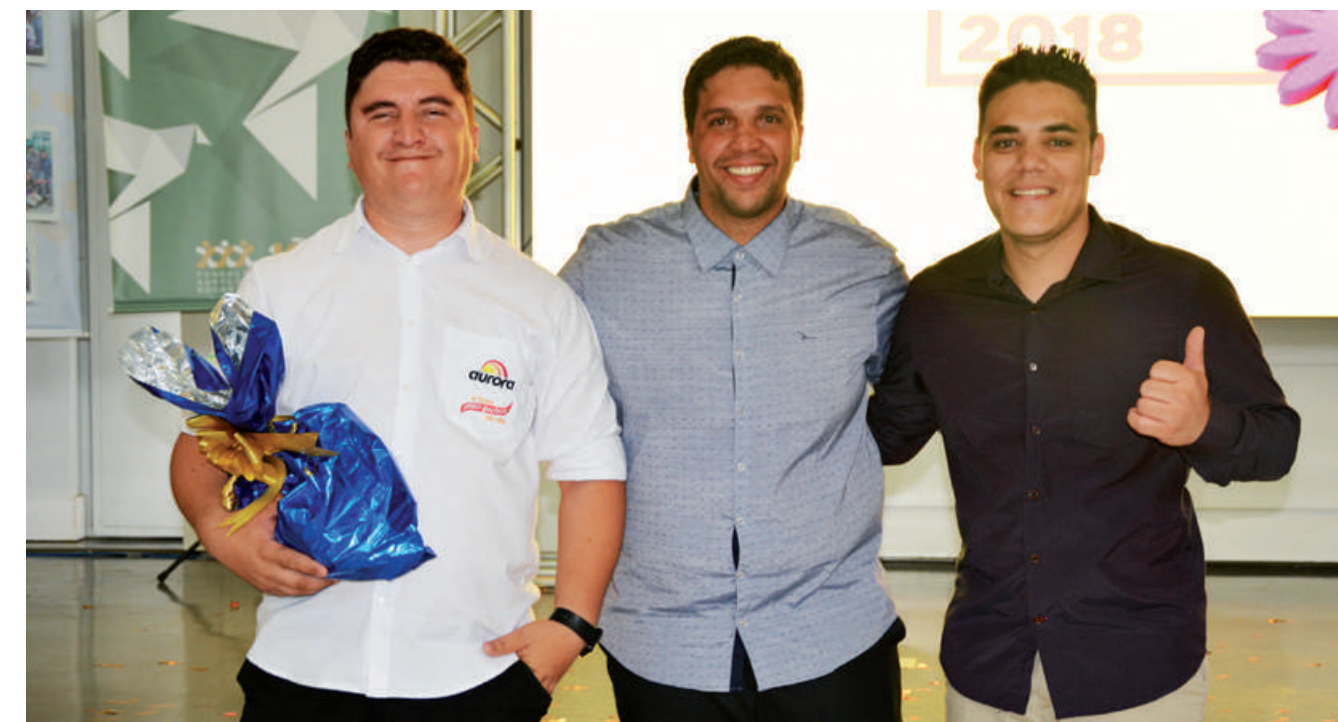
2º LUGAR Centro Logístico São José dos Pinhais