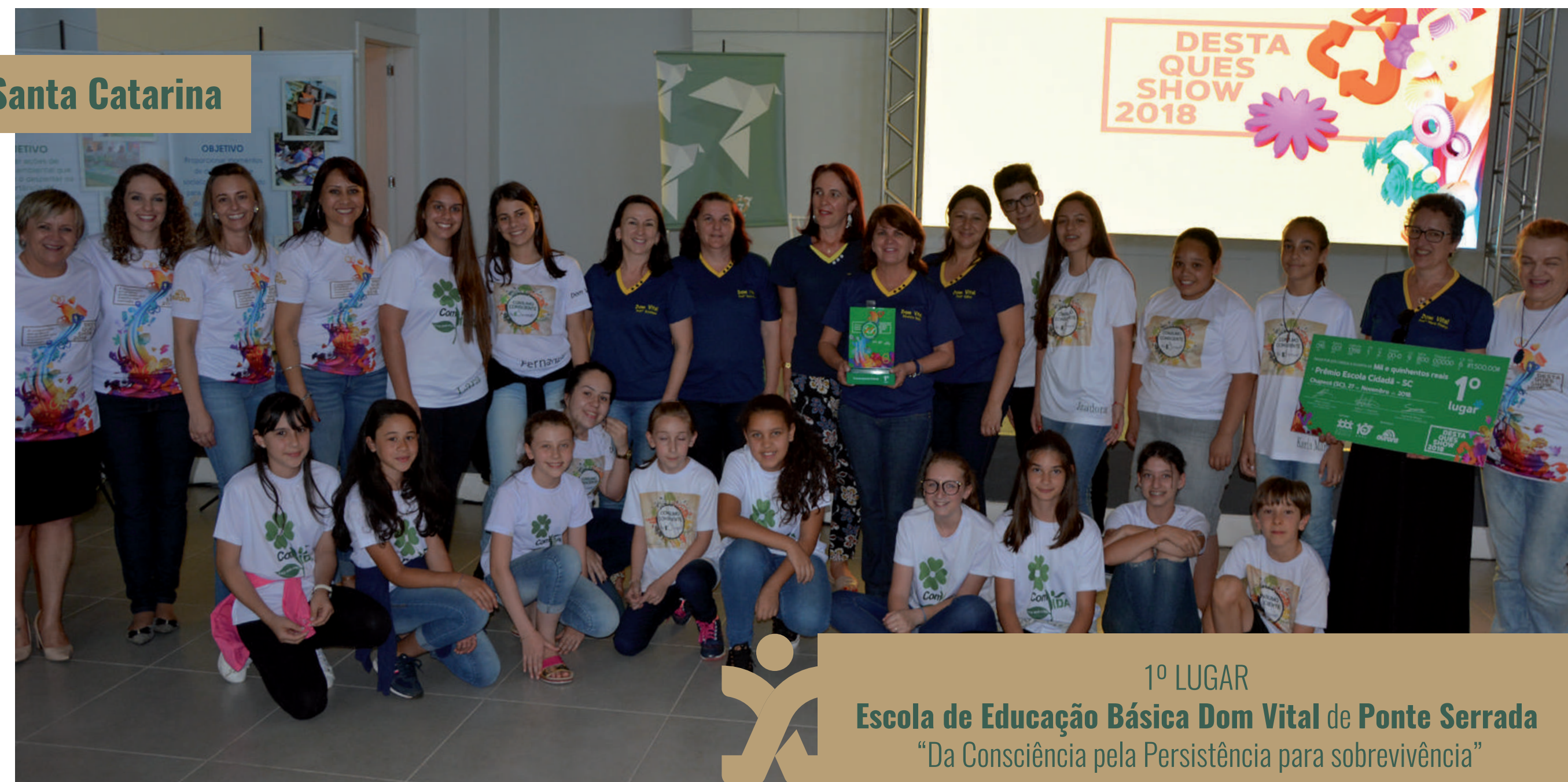
1º LUGAR Escola de Educação Básica Dom Vital de Ponte Serrada “Da Consciência pela Persistência para sobrevivência”