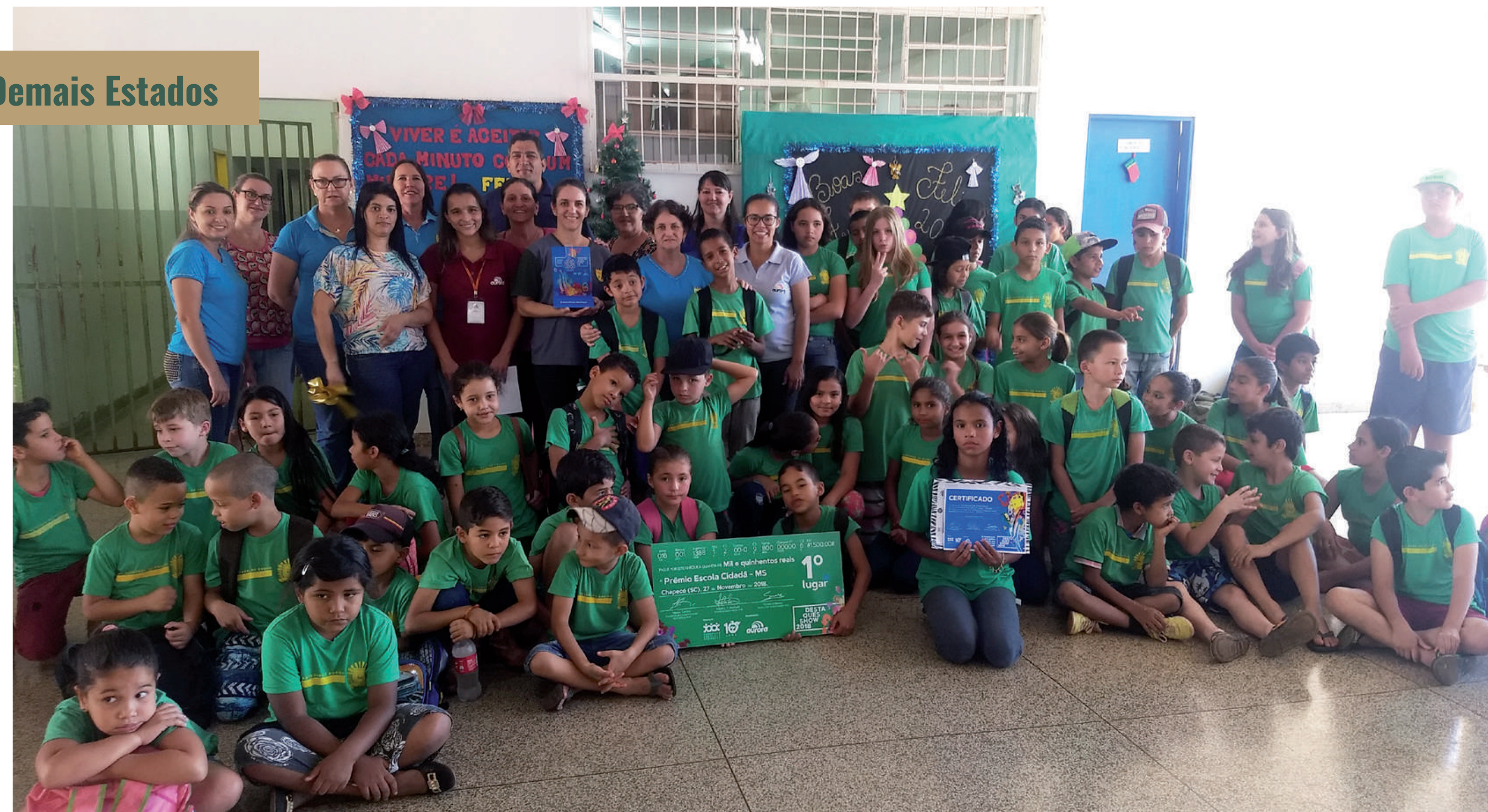
1º LUGAR E.E. Dorcelina Folador de São Gabriel do Oeste (MS)