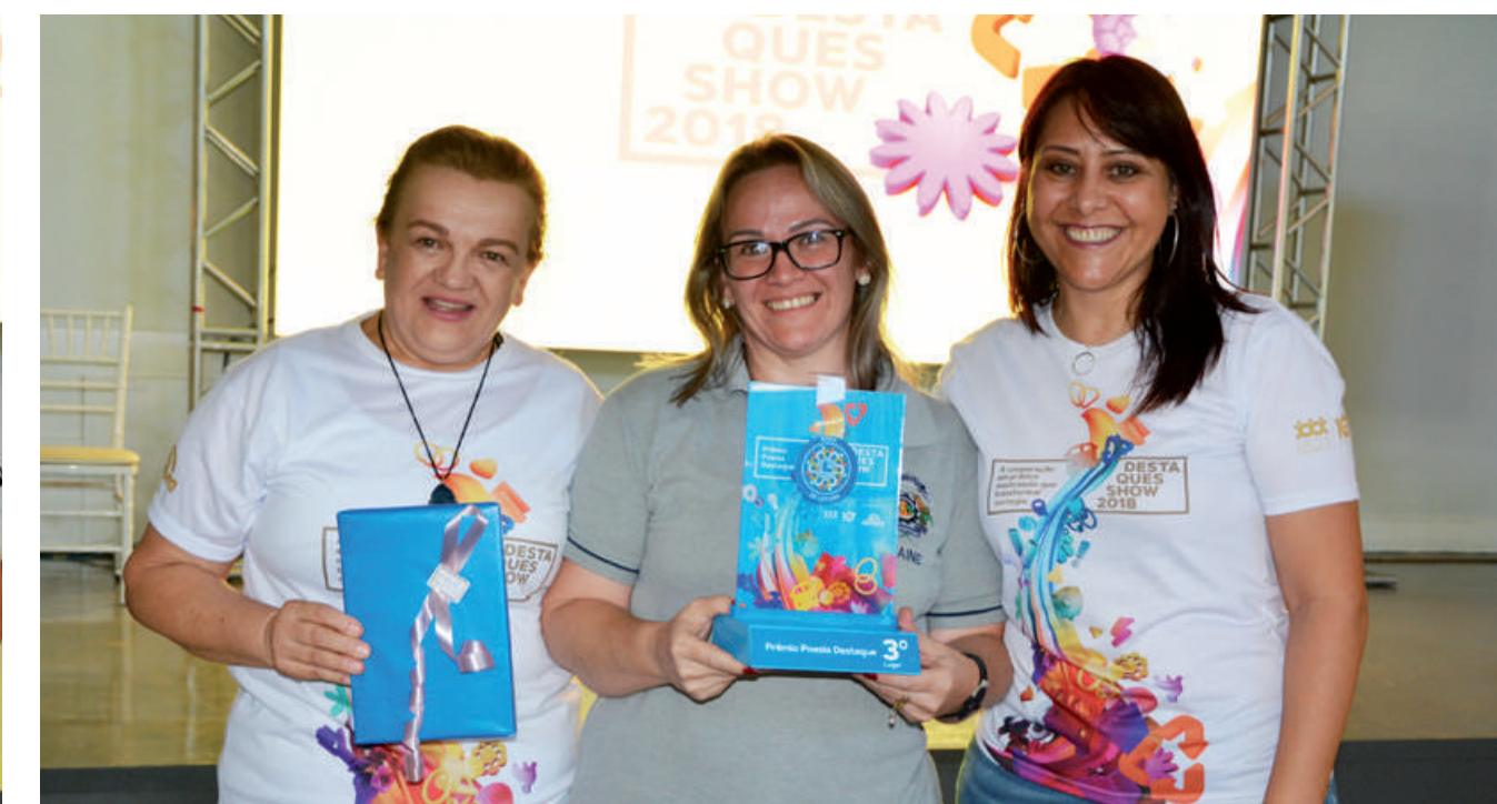
3º LUGAR E.B.M. Agropecuária Demétrio Baldissarelli de Chapecó