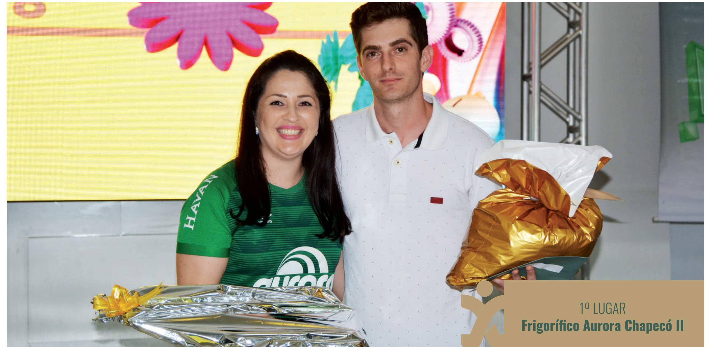
1º LUGAR Frigorífico Aurora Chapecó II

A Paródia da Prevenção faz parte das atividades desenvolvidas durante a Gincana ou Feira da Prevenção, ou através do Concurso de Paródia com o foco na prevenção. A paródia classificada nas unidades como primeiro lugar é encaminhada para concorrer a Premiação da Paródia Destaque da Fundação Aury Luiz Bodanese. A mesma tem como propósito demonstrar através do lúdico a importância das seguintes temáticas: HIV/AIDS, Hepatites Virais e outras DST (prevenção, diagnóstico e assistência), Drogas – Redução de Danos associada ao consumo de Alcool e outras drogas, Relações de Gênero, Orientação Sexual, Violências contra a Mulher e Abuso e exploração sexual de crianças e adolescentes. Ao todo foram 76 paródias e 3989 pessoas envolvidas.