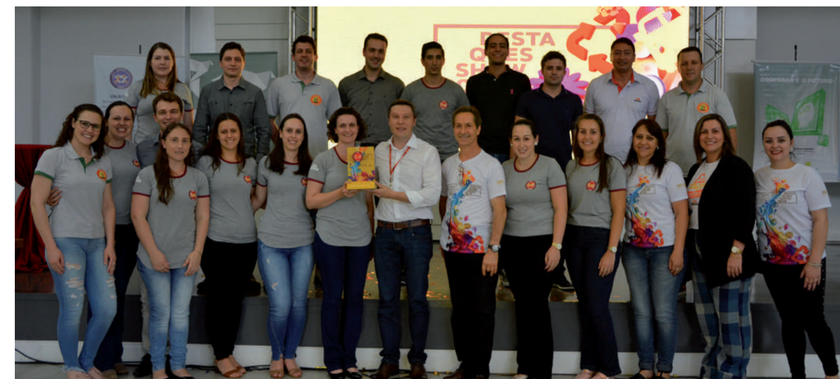
UNIDADE COOPERAÇÃO 2018 (Industriais):