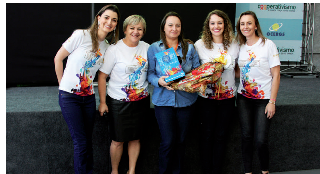
2º LUGAR E.M.E.F. Aratiba de Aratiba