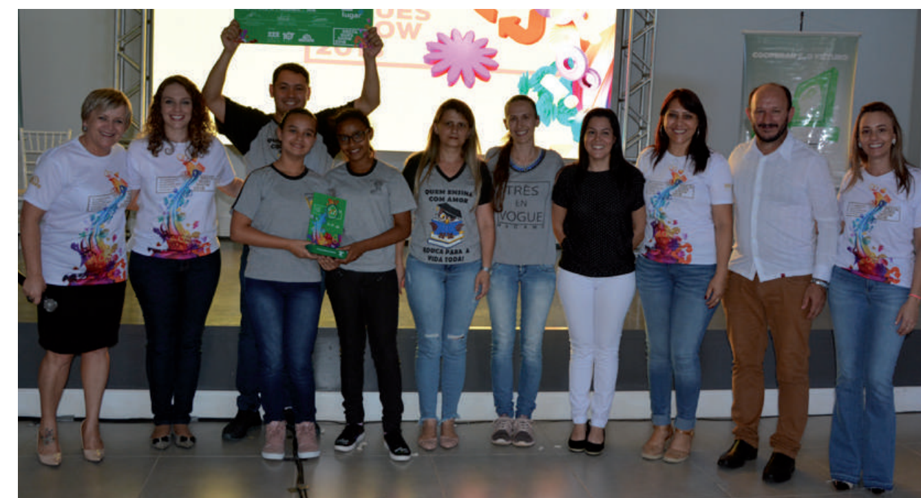
2º LUGAR Grupo Escola Municipal Professor Adolfo Becker de Herval D' Oeste “O futuro está em nossas mãos”