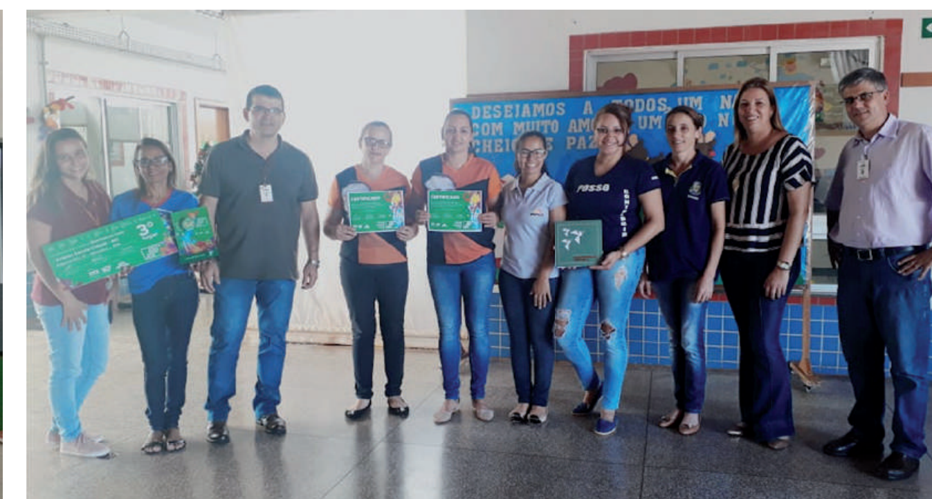
3º LUGAR Centro de Educação Infantil Sonho Meu de São Gabriel do Oeste (MS) “Meio Ambiente: uma questão de consciência”