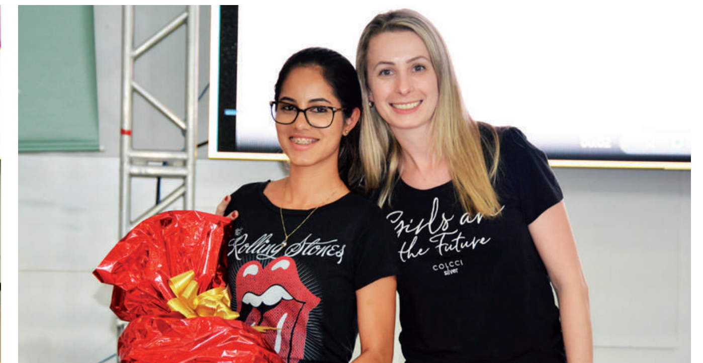
3º LUGAR Frigorífico Aurora Mandaguari