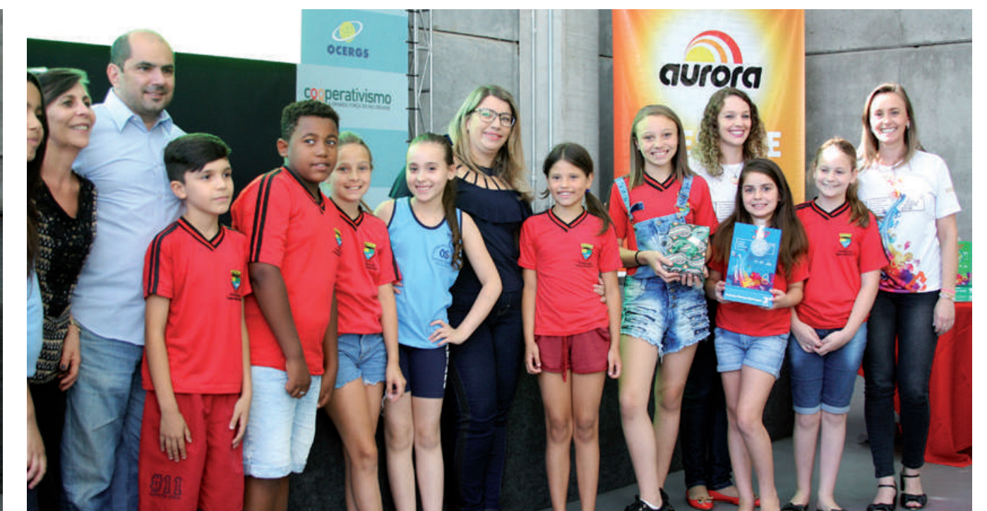
3º LUGAR E.M.E.F. Otaviano Silveira de Sapucaia do Sul