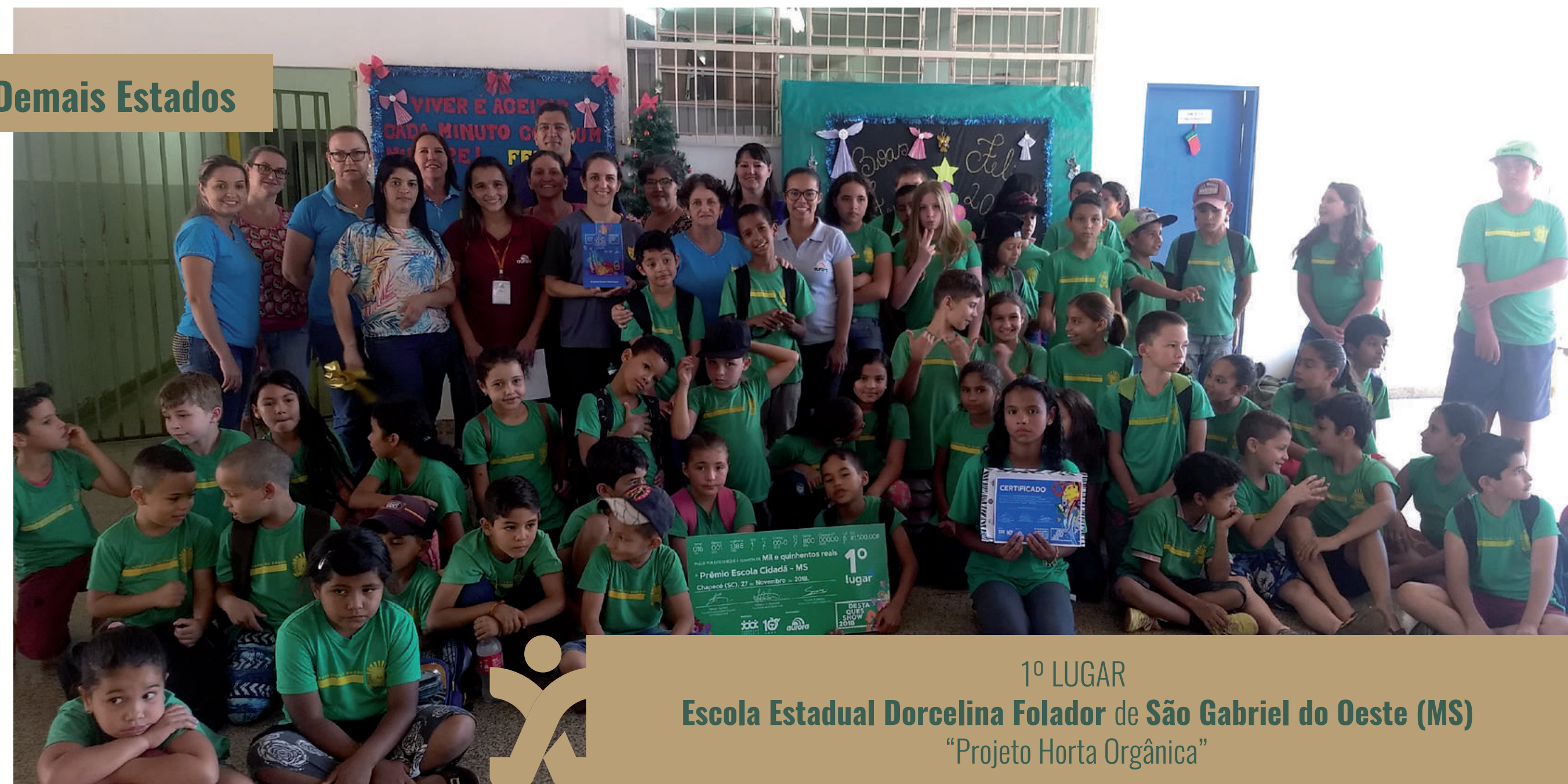
1º LUGAR Escola Estadual Dorcelina Folador de São Gabriel do Oeste (MS) “Projeto Horta Orgânica”