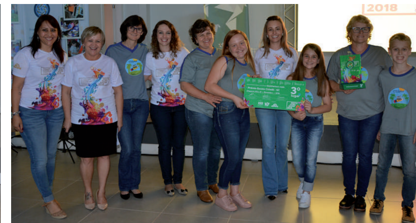
3º LUGAR Centro Educacional Professor José Arlindo Winter de Peritiba “Educação Ambiental no CEPJAW”