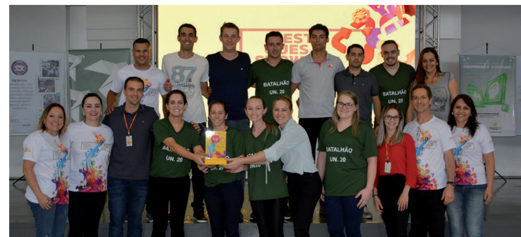
UNIDADE DESTAQUE 2018 (Fábricas de Rações, Lácteos Pinhalzinho, Filiais de Vendas, Comerciais, Granjas e Incubatórios):