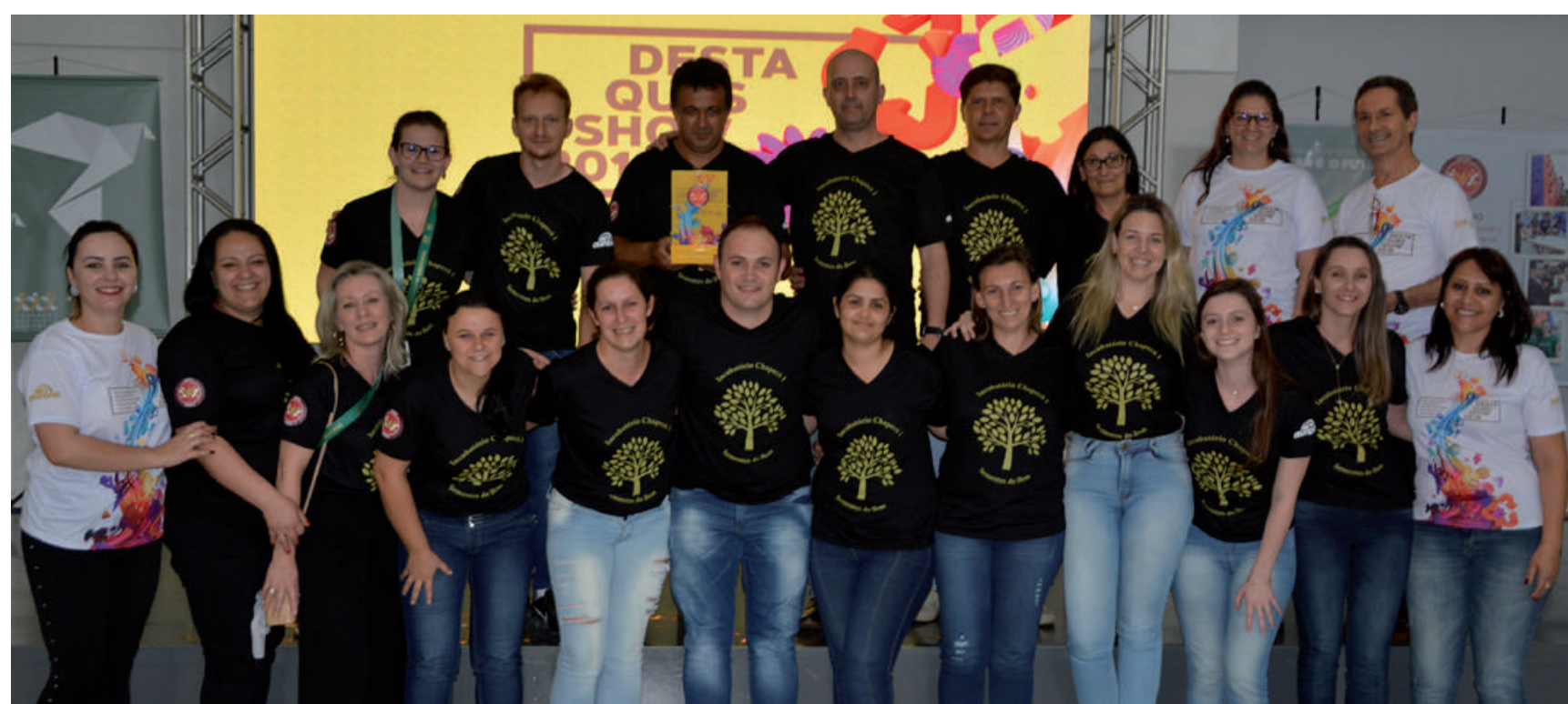
UNIDADE DESTAQUE 2018 (Fábricas de Rações, Lácteos Pinhalzinho, Filiais de Vendas, Comerciais, Granjas e Incubatórios):