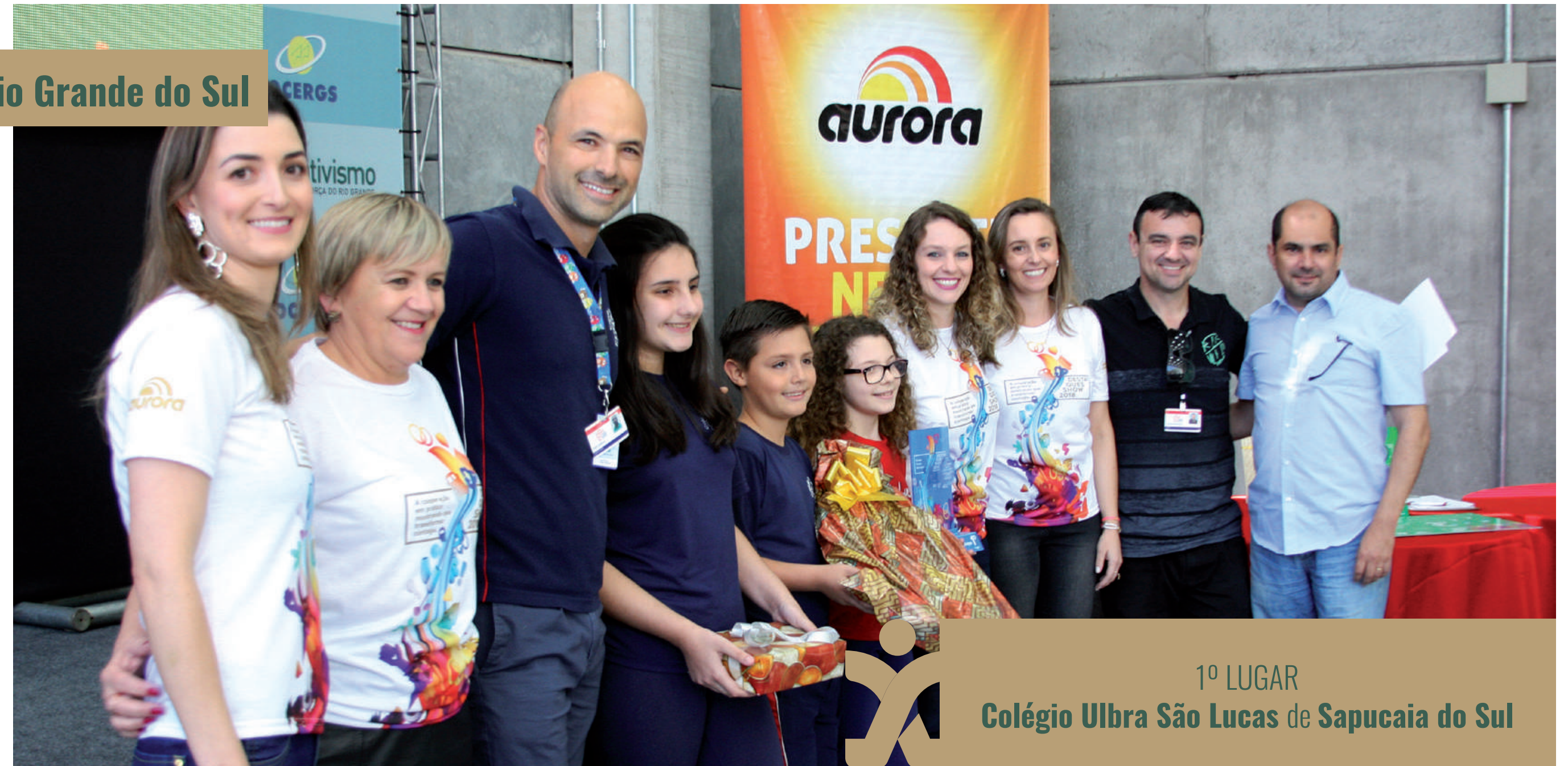
1º LUGAR Colégio Ulbra São Lucas de Sapucaia do Sul