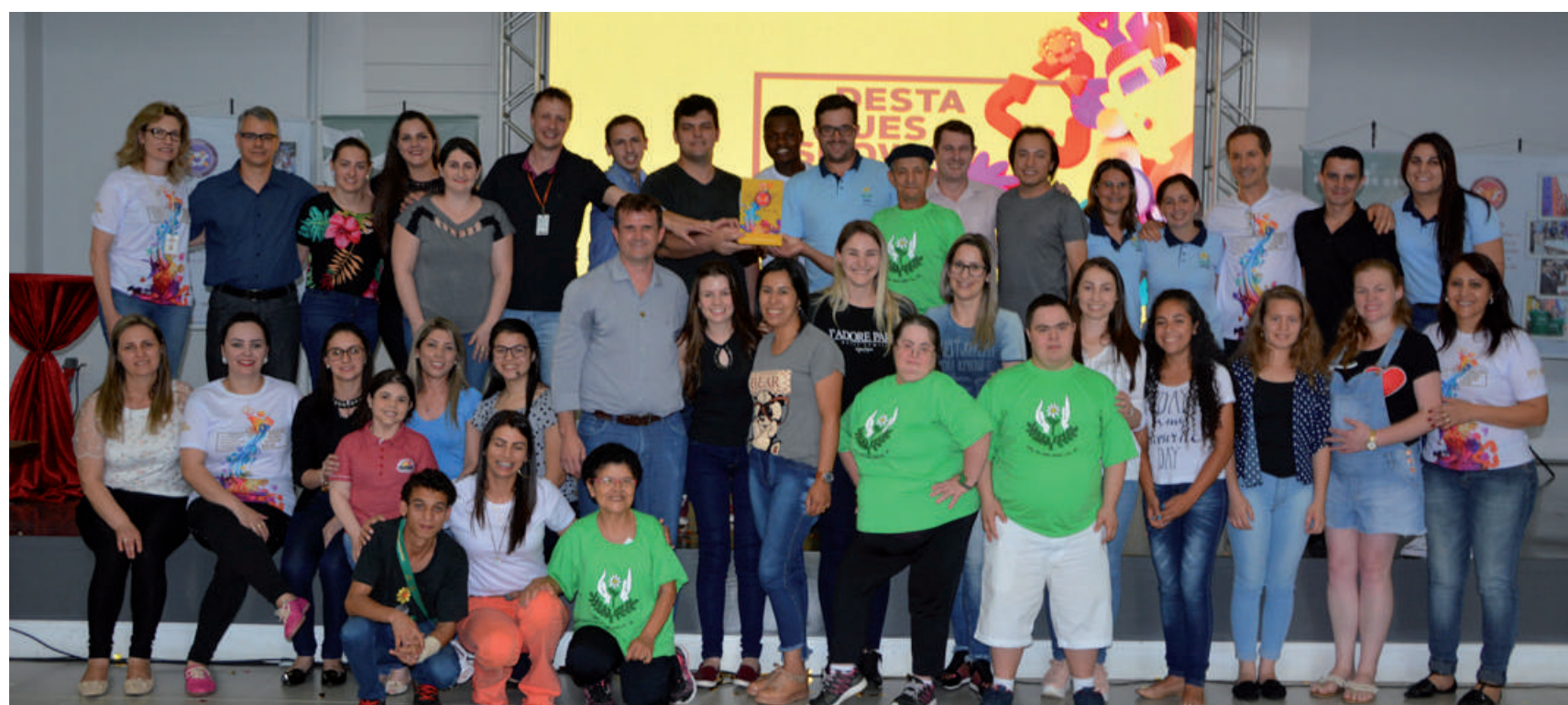
UNIDADE DESTAQUE 2018 (Industriais):